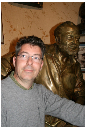
Ernest Hemingway und der Chefredakteur bei der konzeptionellen Arbeit

„Wesentlich wird es bleiben, über anstehende Veranstaltungen zu informieren“